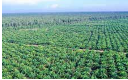
Ilustrasi Perkebunan Kelapa Sawit.

Sertifikasi Yurisdiksi tidak boleh menjadi upaya "greenwashing" bagi perusahaan yang masih melakukan praktik ilegal. Ia menyebutkan, banyak aktivitas perusahaan yang melanggar hukum dan merugikan negara serta lingkungan, terutama di kawasan hutan. "Sebaiknya, persoalan perizinan diselesaikan sebelum melanjutkan sertifikasi ke RSPO," katanya.