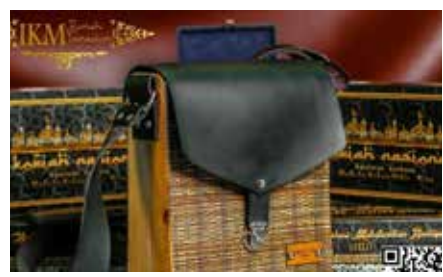
UMKM Rumah Tamadun berhasil mencetak sukses dengan inovasi yang mengubah limbah lidi sawit menjadi produk bernilai tinggi.

Menurut Hendra, penggerak Rumah Tamadun, tas tersebut terbuat dari lidi sawit yang biasanya dibuang sebagai limbah di perkebunan kelapa sawit. "Lidi sawit, yang biasanya hanya dibuang begitu saja, berhasil diolah