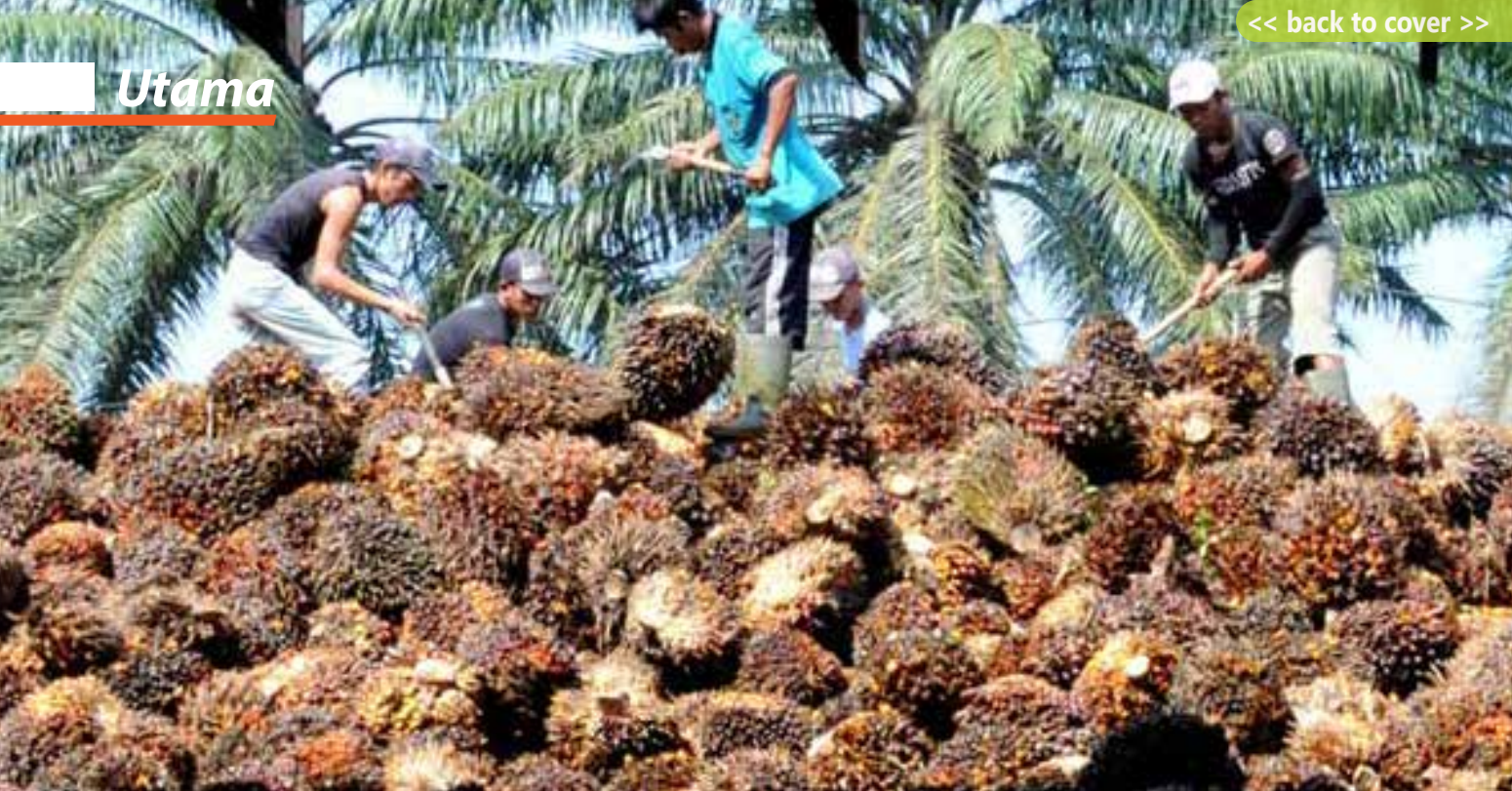
Aktivitas pekerja menurunkan TBS sawit di pabrik pengolahan kelapa sawit.